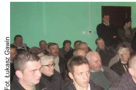
Frekwencja niespotykana w całej gminie

głównym zadaniem jakie planuje w Dziecinowie będzie wykonanie elewacji budynków remizy strażackiej i świetlicy. Dodatkowo zapowiedział zakup samochodu