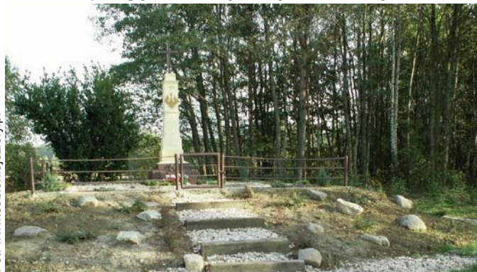
Pomnik Powstańców Styczniowych w Zambrzykowie

przegraną potyczkę z siłami mjr. Kreuza. W dn.18 marca wycofujące oddziały powstańcze zostały rozbite pod Zambrzykowem, zginęło 60 powstańców. W zagrodzie i stajni należących obecnie do Adama Kasprzaka ukrywał się nieduży oddział powstańczy. Został on rozbity przez kozaków, poległy 22 osoby, w tym 2 kobiety. Czterech