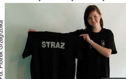
Takiej prezentacji zazdrości nam niejedna OSP

OSP Dziecinów zakupiła za te pieniądze piłę spalinową do drzewa, osiem par butów strażackich oraz dwanaście koszulek z logo Ochotniczych Straży Pożarnych.